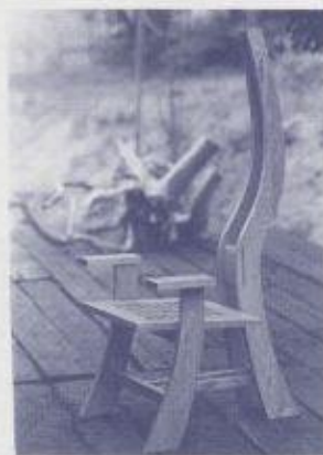
■「トランク」象の鼻のような柔らかさを表現した椅子です。