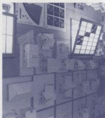
■アトリエの壁に貼られた作品群です。