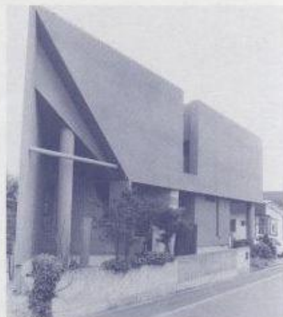
■夢INGのアトリエです。

高断熱? こだわりません。というか、高断熱が完成されていれば全てよし——という考え方はしません。住いの要素としては高断熱といったレベルをはるかに越えて大切なものが沢山あるはず。断熱のことばかりを心配する人には「ローコストで造っちゃっから(造ってあげるから)立派なセーターを1枚買った方がいいんでないか」と几談を云ったりしますが、不自然な程の室内環境が本当によいものとは思えません。