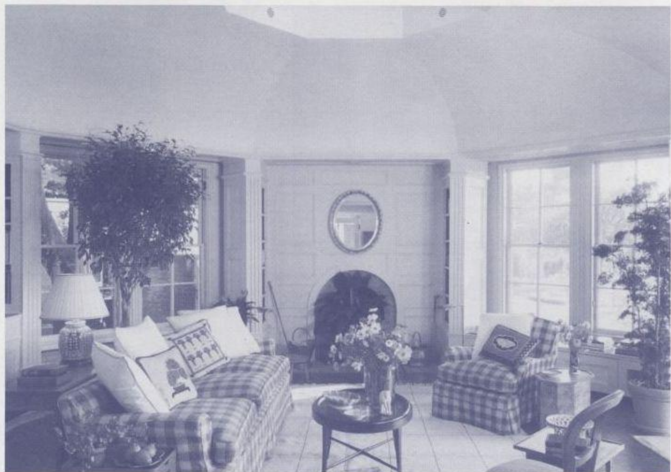
トップライトの陽光とインテリアが輝いています