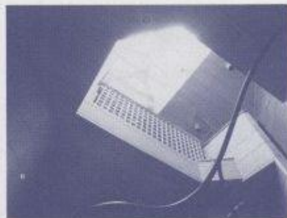
船底のアトリエから見上げたトップライトです。

どうして屋根の形とか、壁の色がそろっていなければいけないのです?美しさは人によって異うはず、様々でいいじゃないですか。そんな中で住民達の「街をキレイにしたいね。花でも植えようか」というコミュニケーション活動として美しくなったのならよいけれど「同じ様につくりました。美しいでしょう、さあ住みなさい」というのが、ボクには分かりません。