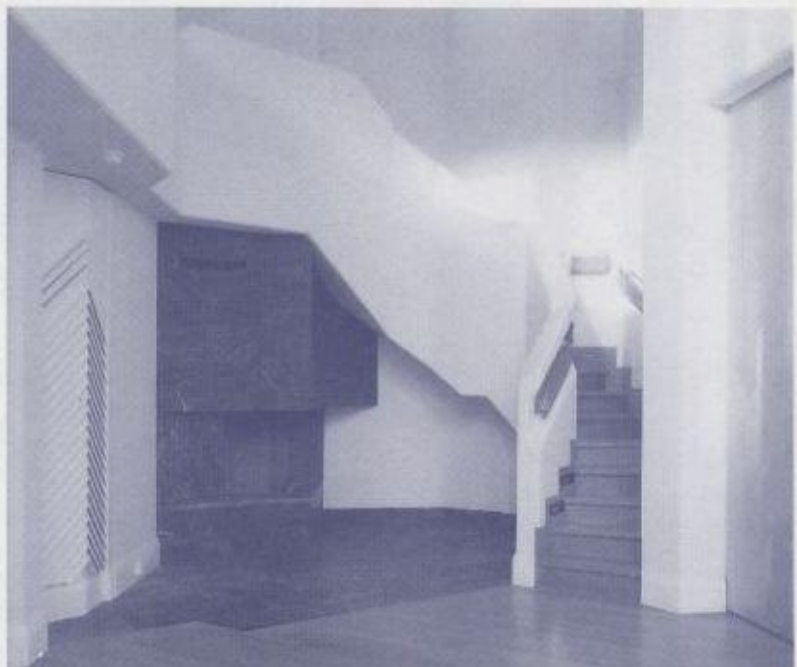
呼吸される木と光による空間です