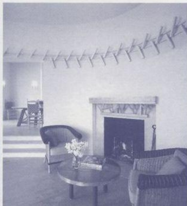
壁面の月桂樹が新しいイメージを伝えます