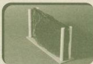
「テントウムシの越冬場」