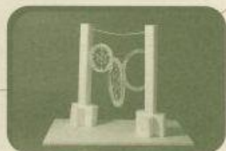
「蜘蛛の高級マンション入居者募集中」