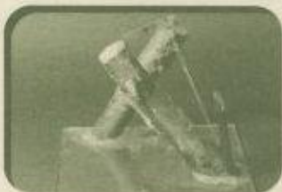
「怠け者にならないナマケモノの家」