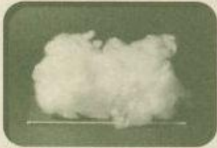
「毛を刈り取られた羊の家」