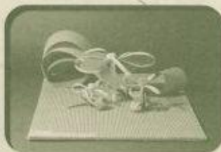
「美しくなる蜂々の家」