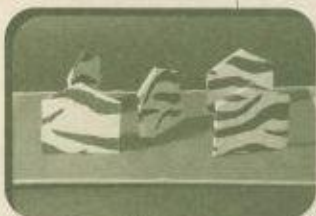
「シマウマの休憩所」

「シマウマの休憩所」は、シマウマ模様の壁が立っている場所をつくり、シマウマを同化させ安心して休息できる場にするという提案。「テントウムシの越冬場」は、濃い色のアクリル板が数枚重なった隙間が越冬場で、太陽熱を吸収して暖かいというところがミソ。「毛を刈り取られた羊の家」は、新しい毛が生えるまで温かく過ごせるようにというもの。これらのグループは、動物への愛情や優しい気持ちを表現したものである。