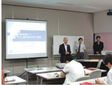
リリカラ商品説明会