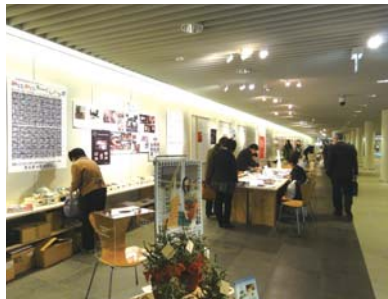
SAPPORO DESIGN WEEK2012参加