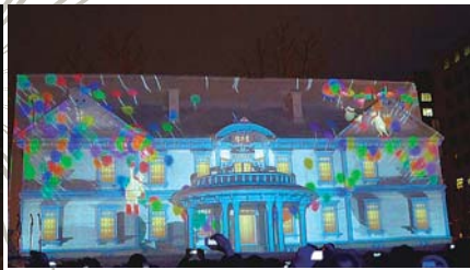
雪像と 3D マッピング