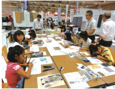
ミニさっぽろ2012参加