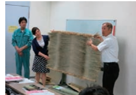
賛助会員セミナー