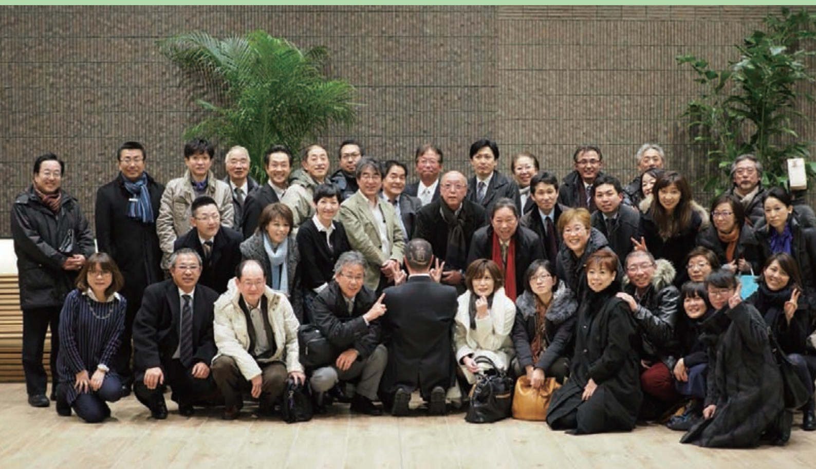
2015 HIPA 新年会