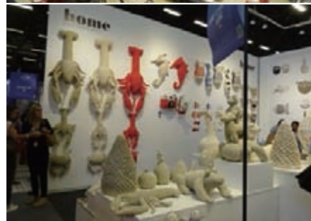
日本からの展示作品