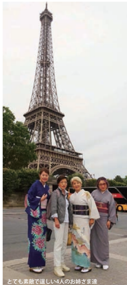
とても素敵で美しい4人のお姉さま達